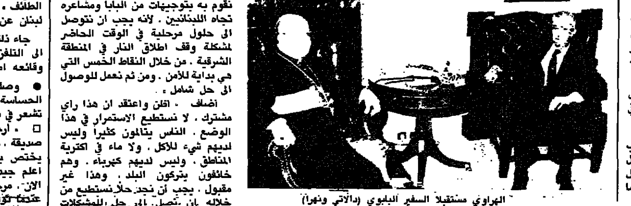
الهراري مستقبلا السفير البايوي (الراي وديار)